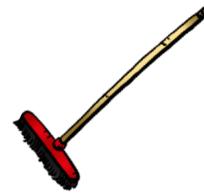
údržba prostor zařízení a pokojů

Pokud uživatel využívá praní osobního prádla poskytovatelem, doporučuje se osobní prádlo označit.