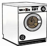
praní prádla, žehlení