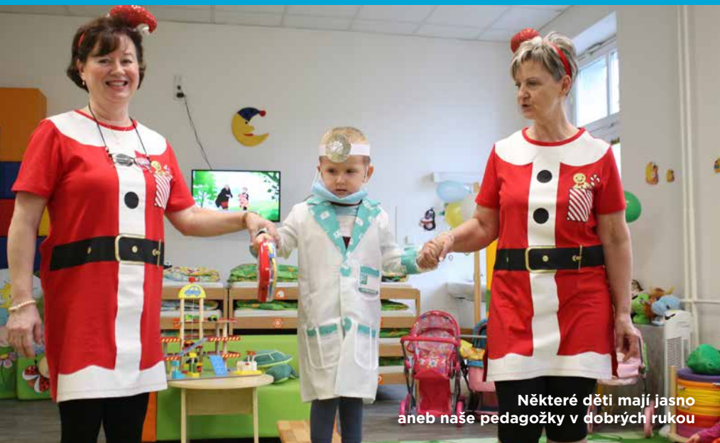
Některé děti mají jasno aneb naše pedagožky v dobrých rukou