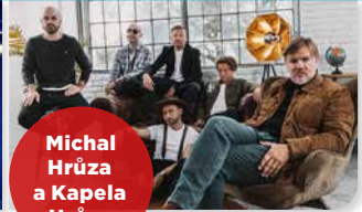
Michal Hrůza a Kapela Hrůzy