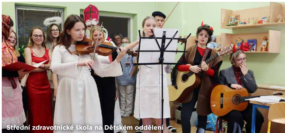
Střední zdravotnické škola na Dětském oddělení

Děkujeme studentům Střední zdravotnické školy a Vyšší odborné školy zdravotnické v Ostravě, dětem ze ZŠ a MŠ Ostrčilova v Ostravě a Pivovaru Ostravar.