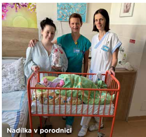
Nadílka v porodnici