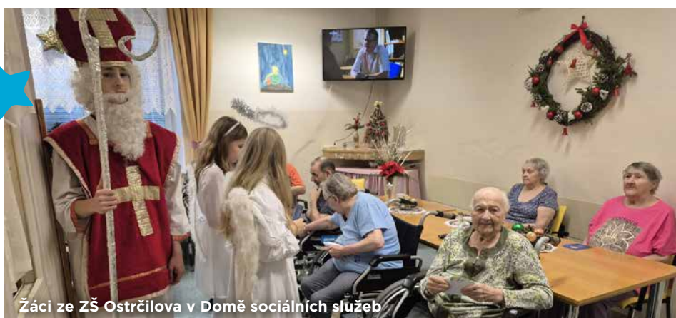
Záci ze ZŠ Ostrčilova v Domě sociálních služeb