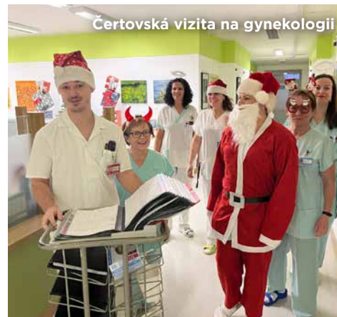
Certovská vizita na gynekologii